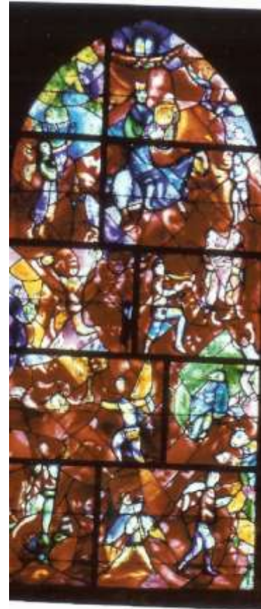
Chagall: Psalm 150 (1977-78) The Arts to the Glory of God

Als het om onszelf gaat blijkt dat een van de boeiendste elementen van de geschiedenis de verhouding is tussen wat hetzelfde blijft en wat verandert. Een oude spreuk zegt: “de tijden veranderen, en wij met hen”, maar bekender nog is misschien de spreuk van Prediker: “Wat geweest is, dat zal er zijn, en wat gedaan is, dat zal gedaan worden; er is niets nieuws onder de zon. Is er iets, waarvan men zegt: Ziehier, dat is nieuw - het was er al in verre tijden, die voor ons waren.” Hoe die verhouding tussen het altijd blijvende en het zich ontwikkelende ook is, het lijkt wel zeker dat er constanten zijn in het menselijke gedrag. De uitingen van vreemdelingenhaat, waar het “beschaafde Europa” momenteel weer zo onder gebukt gaat, zijn ook daarom zo beangstigend, omdat ze passen in het oude patroon, waarlangs de ongenoegens in een samenleving worden afgewenteld op een zondebok. Angst voor wie of wat vreemd is, is zo’n tweede constante in het menselijke gedrag. Continuïteit kan ontmoedigend zijn. Leren we als mensen het dan nooit? Er is, gelukkig, ook continuïteit in het positieve. Het is soms ongelooflijk, hoe mensen die door het leven geslagen zijn, kracht vinden om opnieuw te beginnen, en zich open te stellen voor nieuwe ervaringen van geloof, hoop en liefde.